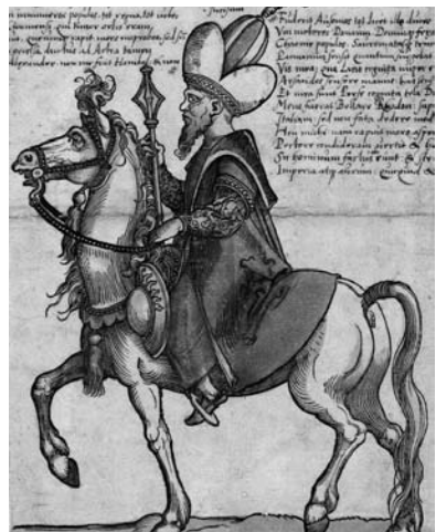
Obr. 4. Veľkovezír Ibrahim (1493 – 1536)