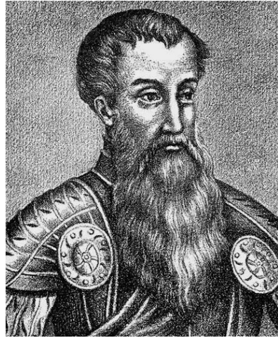
Obr. 6. Viliam z Roggendorfu (1481 – 1541)