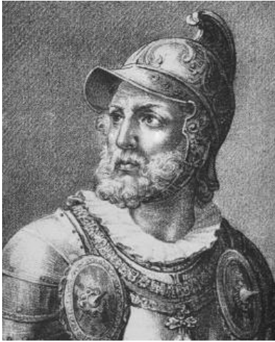
Obr. 5. Mikuláš zo Salmu (1459 – 1530)