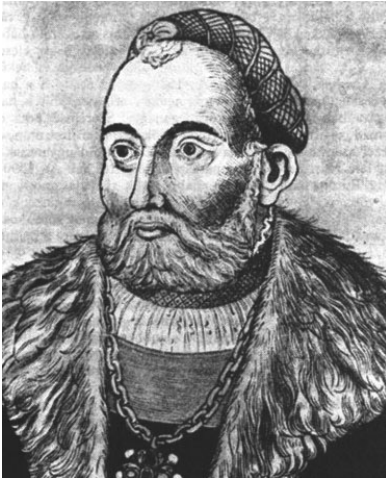
Obr. 1. Ján Zápoľský (1487 – 1540).