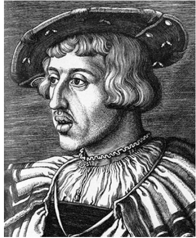
Obr. 2. Ferdinand Habsburský (1503 – 1564)