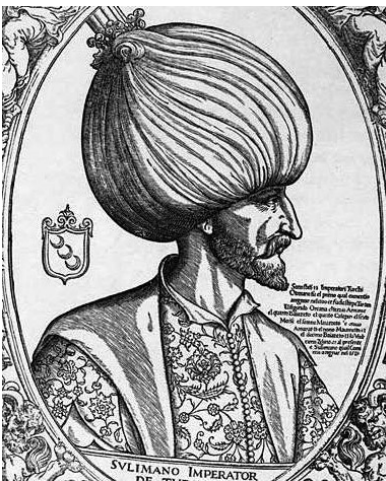
Obr. 3. Sülejman I. Náherný (1494 – 1566)